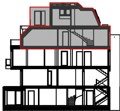
TOP 3 | Dachgeschoss 1, Dachgeschoss 2